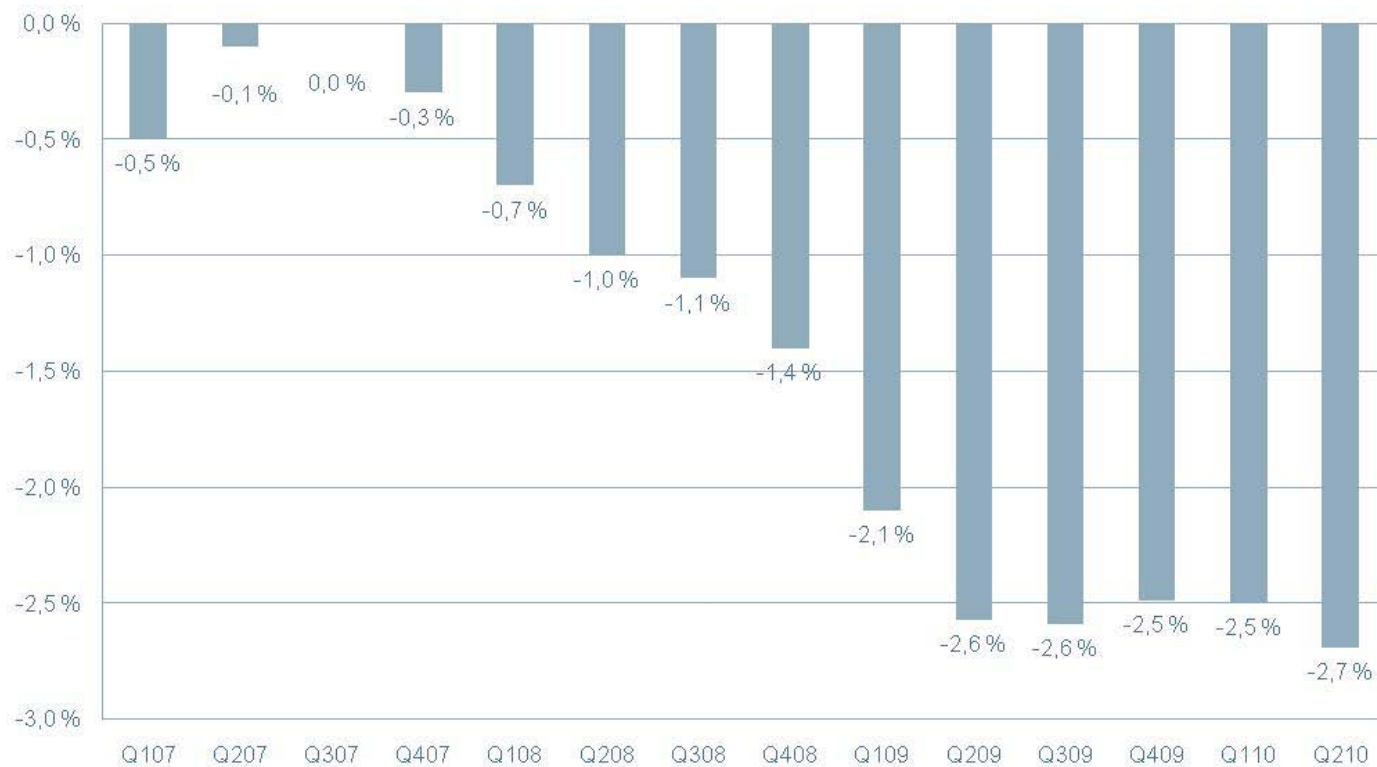
OPPLAGSUTVIKLING LOKALAVISER sammenlignbare aviser, utvikling mot samme periode året før