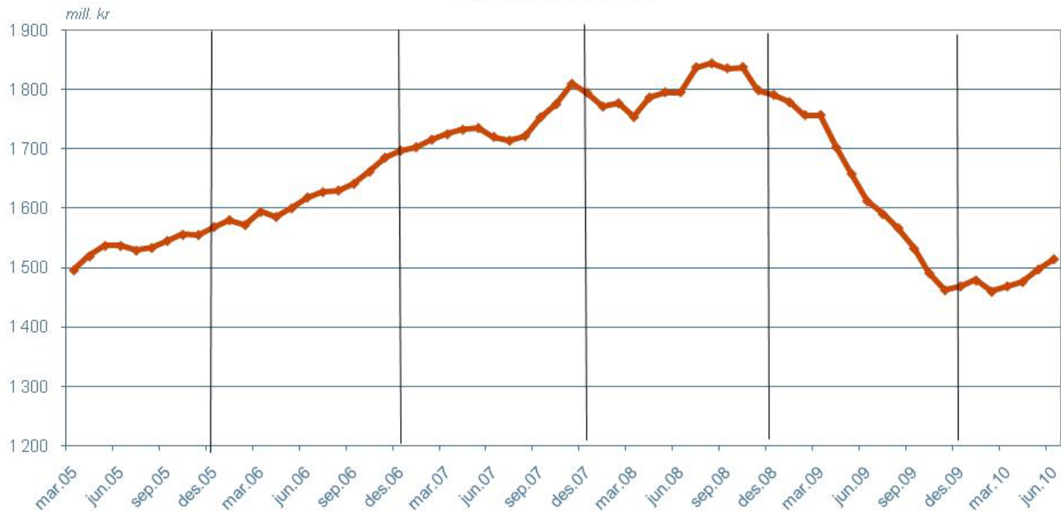
TV 2-REKLAMEINNTEKTER (GRP) TV 2 AS rullerende 12-mnd